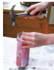
スプレー缶に穴を開ける様子